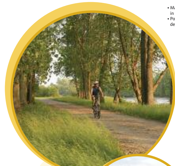
• Parc national de Plaisance