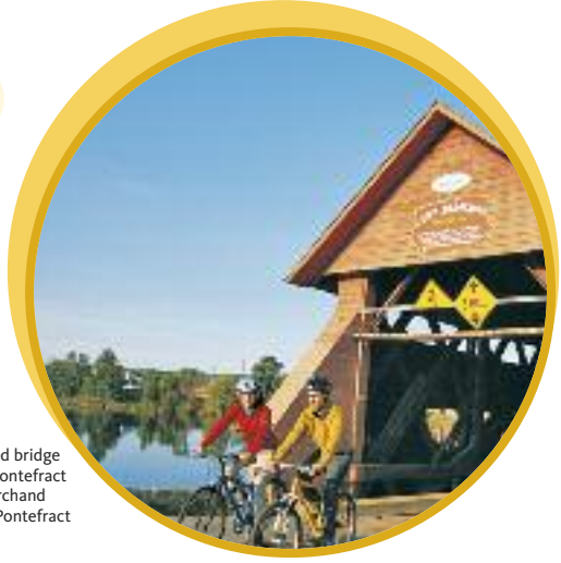
• Marchand covered bridge in Mansfield-et-Pontefract • Pont couvert Marchand de Mansfield-et-Pontefract