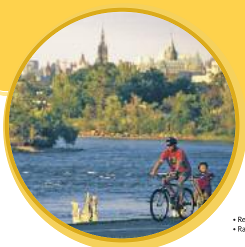
• Remic Rapids • Rapides Remic